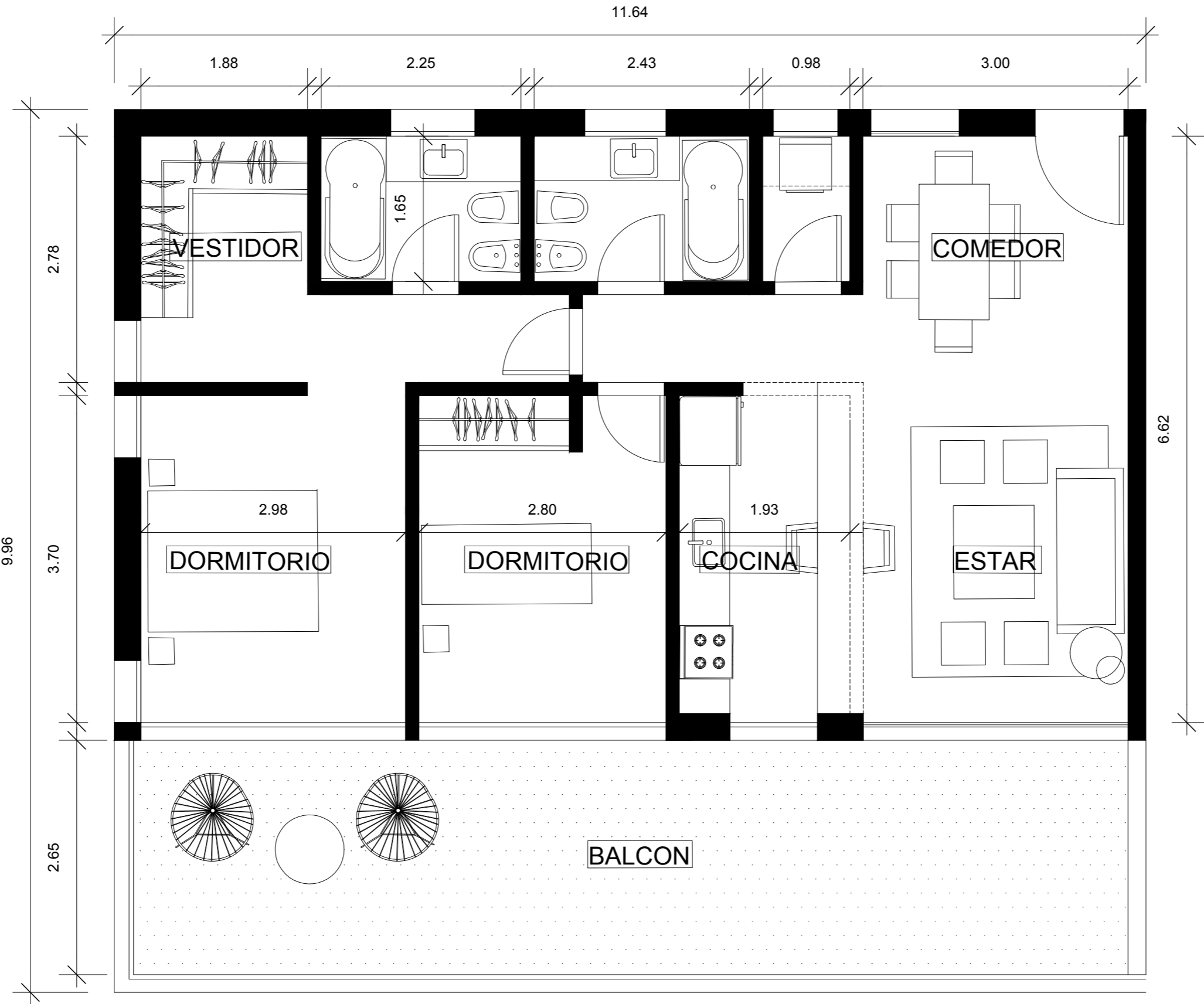
Nivel 1 al 6